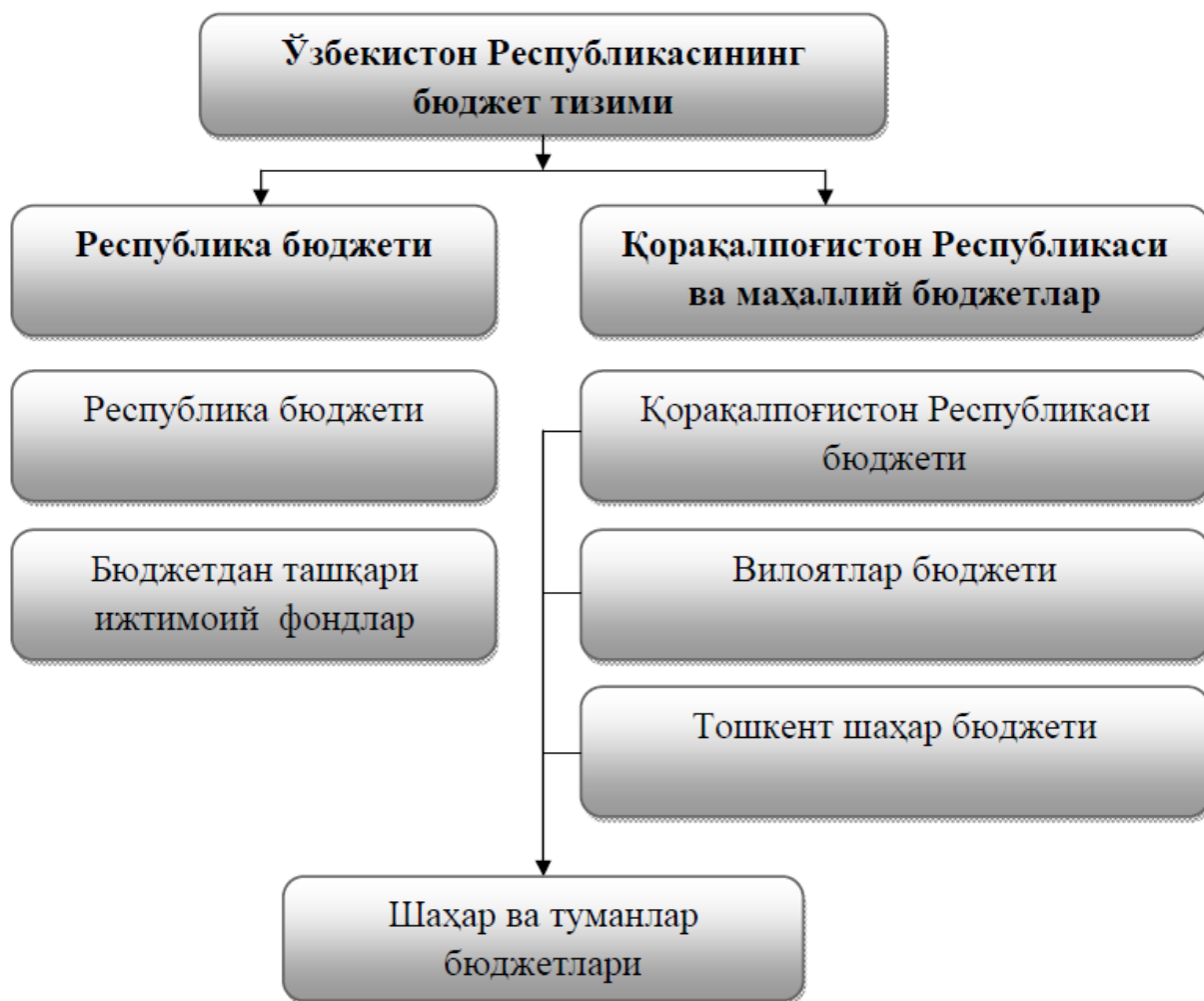
1.3.1-расм. Ўзбекистон Республикасининг бюджет тизими 30 .

Мамлакатимизда олиб борилаётган бюджет-солиқ сиёсатини бугунга қадар такомиллашиб ҳамда мувофиқлашиб келгунига қадар даврни уч босқичга бўлиб ўрганиш мумкин.