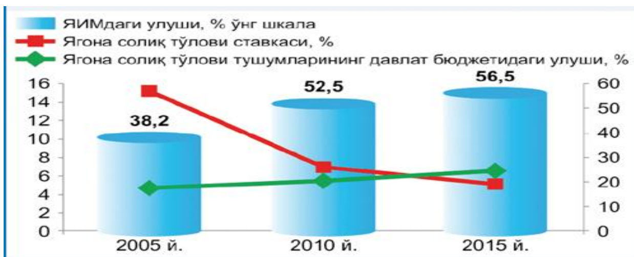
2.3.2-график. Кичик бизнес динамикаси ва солиқлар 40

Текширишлар сони камайтирилгани эса тадбиркорларнинг ишончли химоясини таъминлашда муҳим аҳамият касб этмоқда. Ўзбекистон Республикаси Биринчи Президентининг «Тадбиркорлик субъектларини текширишларни янада қисқартириш ва улар фаолиятини назорат қилишни ташкил этиш тизимини такомиллаштириш борасидаги қўшимча чора-тадбирлар тўғрисида»ги ПФ-4296-сонли Фармониға кўра, янги ташкил қилинган кичик тадбиркорлик субъектларининг (акциз солиғига тортиладиган товарлар ишлаб чиқарувчи кичик тадбиркорлик субъектлари фаолиятини текшириш, шунингдек, бюджет ҳамда марказлаштирилган маблағлар ва ресурслардан мақсадли фойдаланиш билан боғлиқ текширишлар бундан мустасно) молия-хўжалик фаолияти улар давлат рўйхатига олинган пайдан бошлаб, дастлабки 3 йил мобайнида режали солиқ текширувларидан ўтказилмаслиги белгиланди. Ушбу тартиб фермер хўжаликлари фаолиятини текширишга ҳам тегишлидир. Фармонға кўра, 2011 йилнинг 1 апрелидан то 2014 йилнинг 1 апрелигача бўлган даврда солиқлар ва бошқа мажбурий тўловларни ўз вақтида тўлаб келаётган, шунингдек, ишлаб чиқариш суръатларининг барқарор ўсиши ва рентабеллигини таъминлаётган кичик тадбиркорлик субъектларининг молия-хўжалик фаолиятини солиқ соҳасида текшириш тақиқланди.