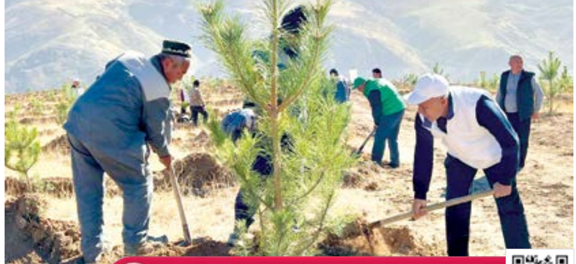
УШБУ МАҚОЛНИ ҚОРАҚАЛПОҚ ТИЛИДА ҲАМ ЎҚИШ УЧУН QR-КОДИ СКАНЕР ҚИЛИНГ!

Шу ватанда туғилиб, уни муқаддас деб билган барча юртдошларимизни жиғидий ўйлашга даъват этаётган ва бунёдкорликка қорлаётган бу каби вазифалар, албатта, келажак авлод ҳаёти учун қилинаётган ишлардан баъзиларидир.